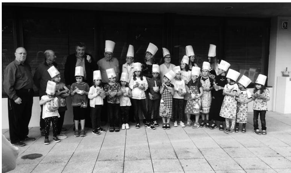
El concurs d'allioli per a nens, organitzat al Museu del Joguet de Figueres, va ser un èxit.