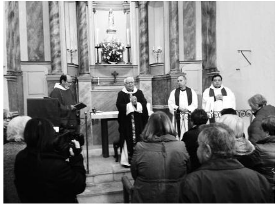
El bisbe de Girona beneeix la nova imatge de la Verge de Creixell, obra de l'escultora Ció Abellí. 4 de desembre de 2016.

Pot ser quelcom breu –abans en dèiem “jaculatories”– com ara: “Santa Maria, pregueu per nosaltres”, “Jesús, Josep i Maria, us dono el cor i l'ànima mia”, “Verge Maria, Mare de Déu, ¡pregueu a Jesús per mi!”, o senzillament “Ave Maria Puríssima”... o el que se'ns acudeixi. ¡A una mare se li ha de parlar amb respecte, però tampoc calen tants miraments! Diguem-li el que ens surti del cor.