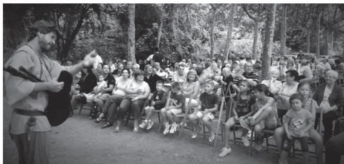
Actuació de Lo Sacaire del Llobregat a la Festa Major 2017.