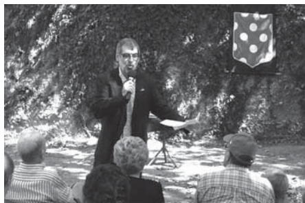
En Dacó fent el seu pregó davant els creixellencs.

Per començar, els lledoners de davant la placeta, amb algun de bifurcat i altres als marges del carrer del doctor Frigola que tenen unes arrels que semblen pops , per aguantar la terra i evitar esllavissades. I les branques estintolen la gent gran... perquè del lledoner se'n fan bastons .