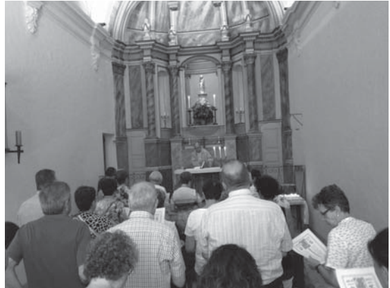
Missa a Creixell.

El dia 8 de setembre és, en el calendari litúrgic, una gran festa mariana: el naixement de la Mare de Déu (que s'escau, si ens hi fixem bé, nou mesos després de la Immaculada Concepció).