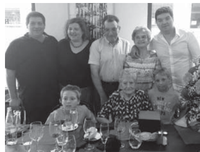
Celebració dels 100 anys de la Montserrat de Can Cortada amb la família.