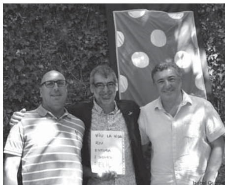
L'alcalde de Borrassà, el pregoner de la festa i el president de l'Associació de Veïns i Amics de Creixell després del pregó.