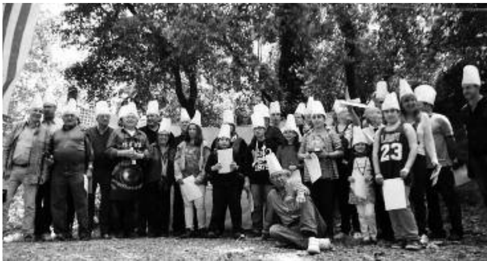
Concursants del XXII Concurs d'Allioli de Creixell després de recollir els premis.